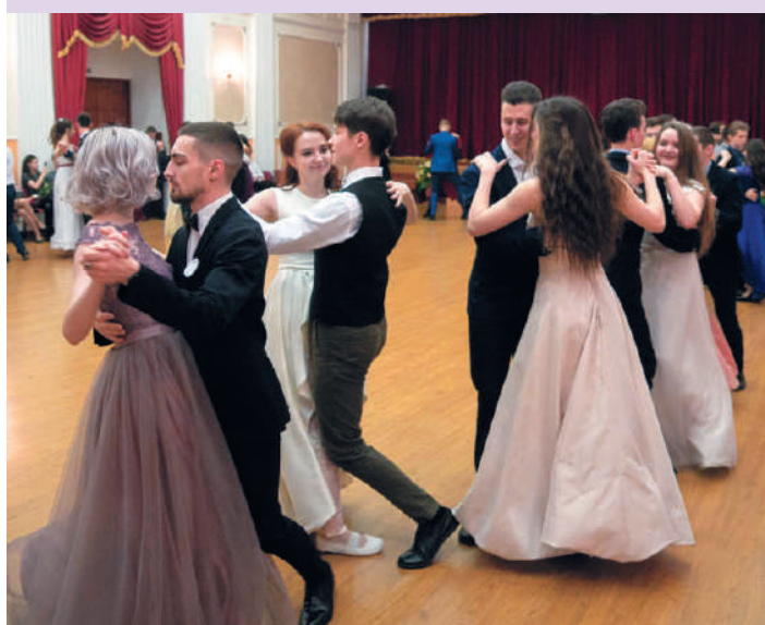
Новогодний бал в Царском зале УГГУ

В конце декабря в университете зажигает свои огни Международная новогодняя елка . Гости знакомятся с новогодними традициями всего мира, а поздравления в этот день звучат на нескольких иностранных языках. В Горном университете считают, что уважение к иным традициям, культурам, обычаям надо воспитывать смолоду, поэтому в вузе проводится много мероприятий, раскрывающих национальные особенности народов, живущих на территории нашего округа.