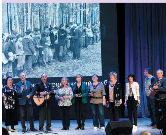
Праздничный концерт на Форуме выпускников

Ежегодно в первую субботу июня более тысячи горняков собираются в стенах родного вуза, чтобы увидеться с давними друзьями и вспомнить о самой лучшей поре своей жизни — веселом студенчестве. Форум выпускников Горного — это радость встречи тех, кто получил заветную белую каску горного инженера. Все они члены дружного горняцкого братства, основы которого заложены в родной альма-матер — в Горном университете.