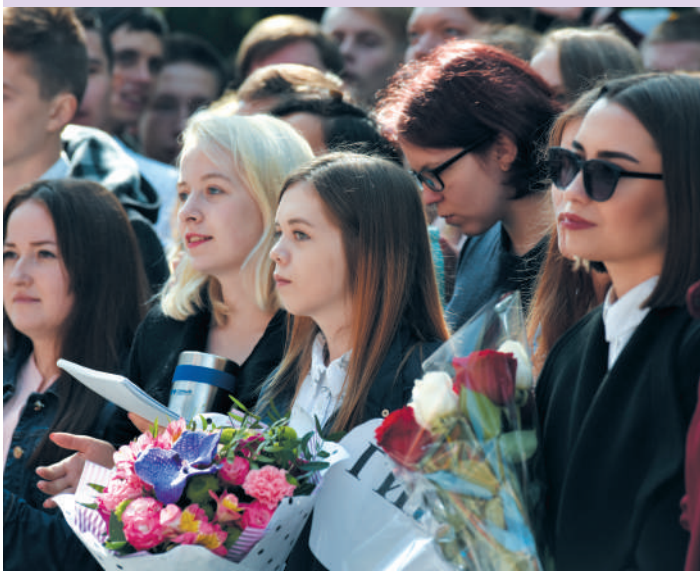
Первокурсники на торжественной линейке

В течение недели студенты знакомятся с научной библиотекой и Уральским геологическим музеем, посещают Храм горняков и значимые места Екатеринбурга, а также успевают побывать в театре и реализовать с помощью кураторов собственные социальные проекты.