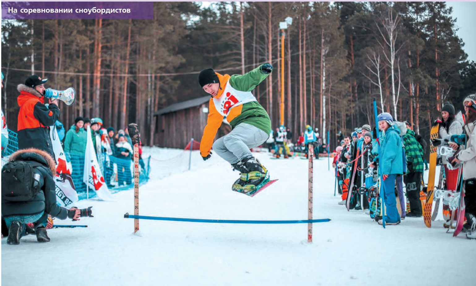
На соревнованиях сноубордистов

Вопрос, чем заняться в каникулы, не волнует студентов-горняков. Самые продолжительные, летние каникулы они всегда проводят с пользой для себя, работая в студенческих отрядах и занимаясь в клубах по интересам.