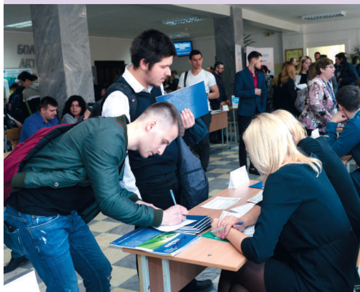
Уральская горнопромышленная декада — 2019. Ярмарка студентов