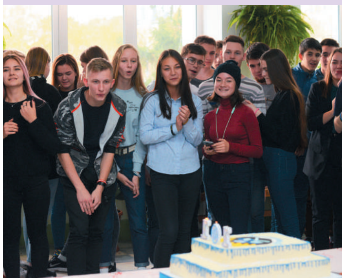
В ожидании праздничного чаепития

В прошлом году в Горном родилась новая традиция — отмечать начало занятий в первом вузе Урала (10 октября 1917 г.) увлекательным квестом. Университет был основан в 1914 году, а первые лекции для студентов начались три года спустя в октябре месяце. На праздничном столе участников квеста ждал сюрприз — фирменный 11-килограммовый торт.