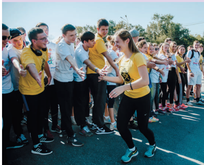
Студенты-горняки на «Кроссе нации»

В здоровом теле – здоровый дух, ни один «Кросс нации» не обходится без горняков. Не сотни – тысячи студентов каждый год дружно выходят на старт и бегут единой командой с флагами Горного и прекрасным настроением.