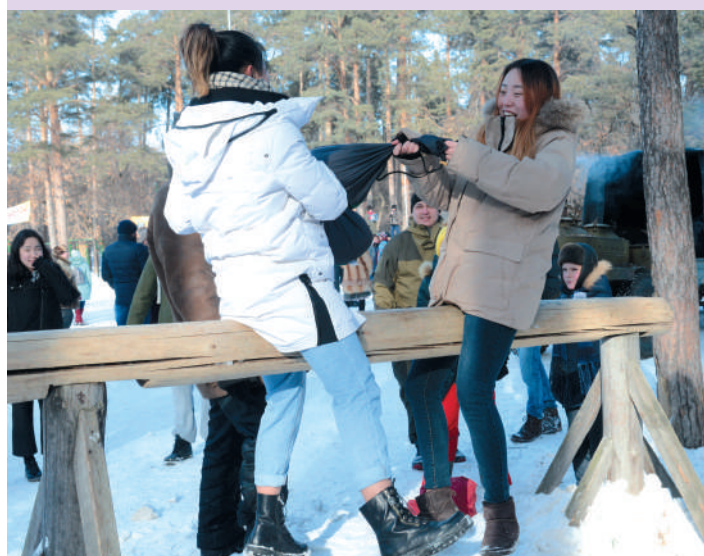
В русских народных играх принимают участие также иностранные студенты