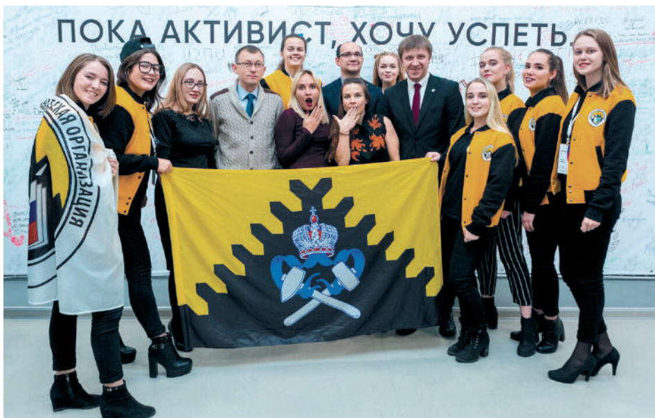
Студенты-горняки в Тюмени на конкурсе «Лучшее профбюро УрФО и СФО – 2018». Среди 13 команд сборная профбюро факультета геологии и геофизики УГГУ заняла 5-е место

6. Горный университет создает условия для раскрытия потенциала каждого студента . Ребятам с активной жизненной позицией можно реализовать себя в профкоме и Союзе студентов. Для тех, кто тяготеет к творчеству или спорту, есть много коллективов и секций, которые нередко представляют Горный универ-