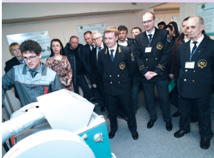
Уральская горнопромышленная декада — 2019. Открытие на кафедре горных машин и комплексов УГГУ учебно-исследовательской лаборатории ООО «Вибротехник» (г. Санкт-Петербург)

В рамках декады проходит Ярмарка студентов , в которой принимают участие старшекурсники. Подобрать квалифицированные инженерные кадры на постоянную работу со студенческой скамьи приезжают представители различных предприятий и крупных компаний, и будущие молодые специалисты имеют возможность из первых уст узнать об условиях и социальных пакетах, которые гарантируют работодатели.