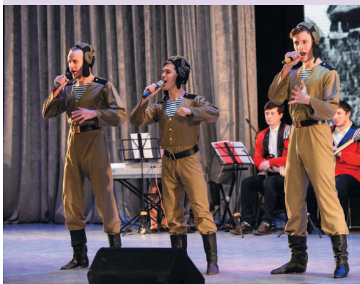
Традиционный праздничный концерт в честь Дня защитника Отечества в Большом актовом зале УГГУ – Зале УГМК

Какой горняк не любит русскую Масленицу , знаменующую окончание зимы! Ее любят все, а традиционные блины и забавы стали близки и студентам из Гвинеи, Монголии, Китая и многих других стран. Праздник Горный университет организует в парке «Зеленая Роща», куда приходят повеселиться и угоститься блинами жители Ленинского района.