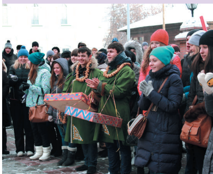
В Горном университете празднуют Татьянин день