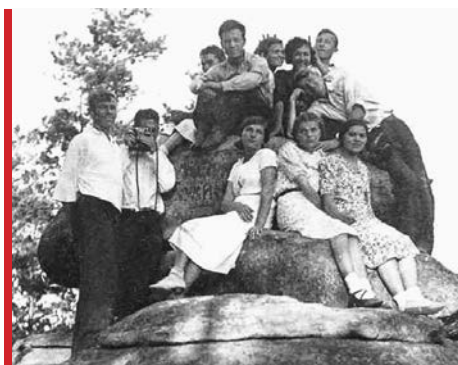
Студенты групп РПИ и ГМР на Шарташских каменных палатках. 1940 год