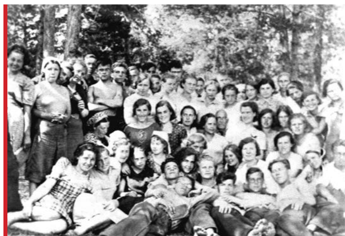
Студенты групп РПИ-21, ГМР-21, ГН-21 на геологической практике в Сухом Логу. 22 июня 1941 год