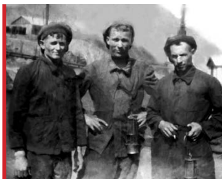
Студенты группы ГЭМ-31 на практике в Донбассе. 1939 год