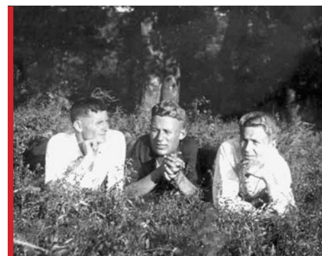
Студенты группы ГЭМ-31 отдыхают в свободное от практики время. Донбасс. 1939 год

В феврале институт готовился к встрече XVIII Всесоюзной конференции большевистской партии и выполнил свои обязательства, подготовив одну докторскую и пять кандидатских диссертаций.