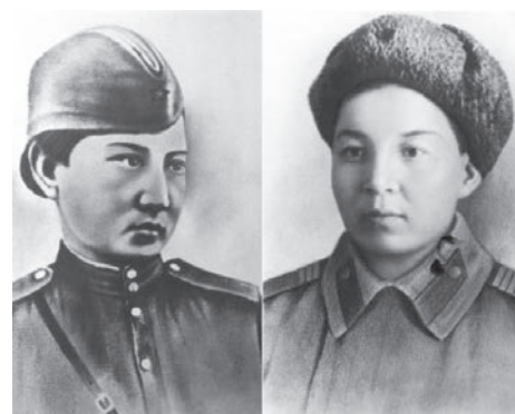
Алия Молдагулова и Маншук Маметова

Двадцать один год прожила Маншук, когда вражеская пуля оборвала ее жизнь. Жизнь, которая еще только начиналась и в которой предстояло еще познать любовь и верность, чувство материнства и радость от любимой работы. Она осталась совсем одна, враги наступали, но, обставившись тремя пулеметами, три часа Маншук сдерживала яростные атаки противника. Взрывной волной опрокинуло пулемет, кровь залила лицо Маншук. Она погибла, но жители города Невель, за который Маншук отдала свою жизнь, свято чтят память о юной казахской героине.