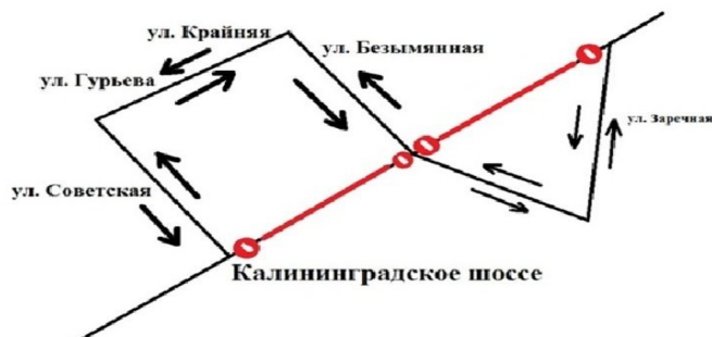
Рисунок 2 – Схема объезда 5

Если рисунок является авторской разработкой, необходимо после заголовка рисунка поставить знак сноски и указать в форме подстрочной сноски внизу страницы, на основании каких источников он составлен, например: