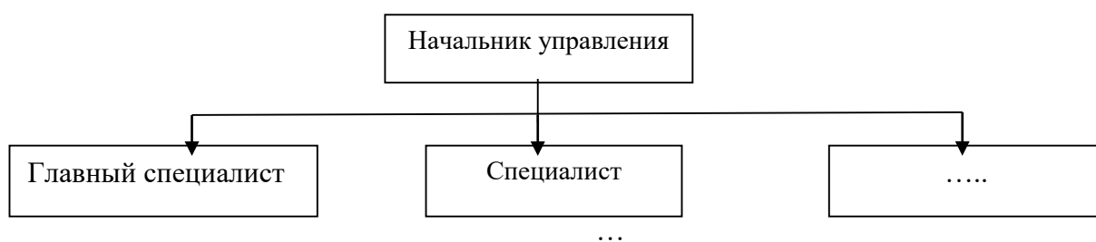
Рисунок 1 – Структура управления

Рисунки следует нумеровать арабскими цифрами сквозной нумерацией по всей работе. Каждый рисунок (схема, график, диаграмма) обозначается словом «Рисунок», должен иметь заголовок и подписываться следующим образом – посередине строки без абзацного отступа, например: