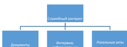
Рисунок 1 - Процесс заключения служебного контракта [8, с. 46]

Если рисунок взят из первичного источника без авторской переработки, следует сделать ссылку, например: