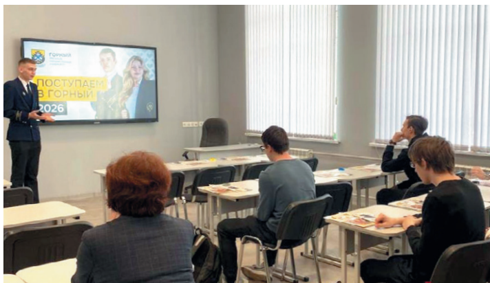
Профориентационное занятие для школьников в аудиториях УГГУ